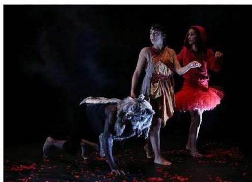
6e Dimension

Voilà la question de la saison des fêtes : On joue ? On conte ? On danse ? C'est tout à la fois. Trois contes de notre enfance, interprétés par trois B-Girls et un B-Boy ne font pourtant pas un spectacle pour enfants. « Dis à quoi tu dances ? » s'adresse aussi aux enfants, mais pas seulement. Trois contes, trois tableaux, trois ambiances.