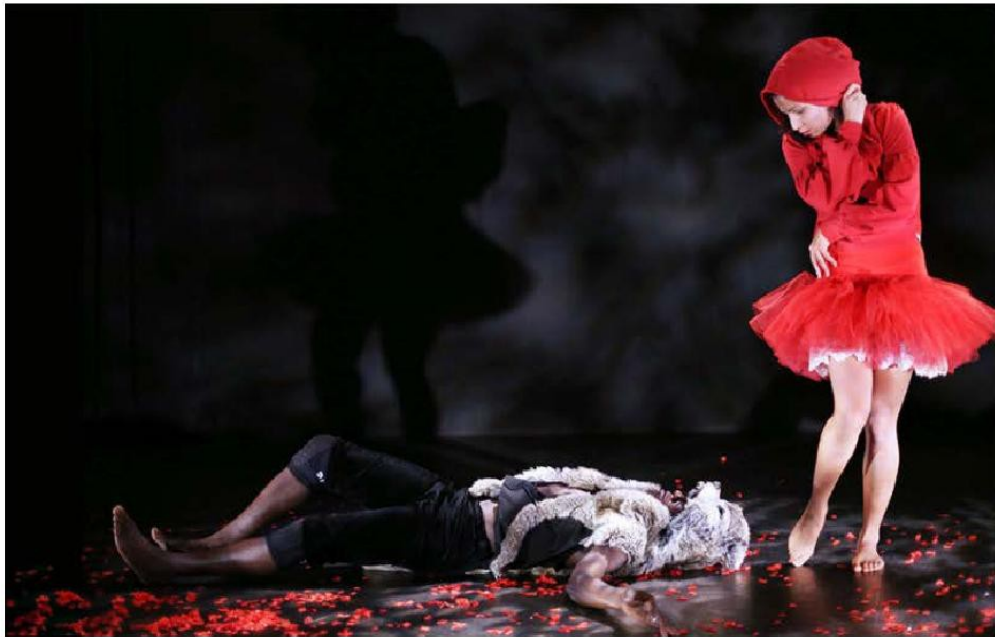
6e Dimension © Patrick Berger