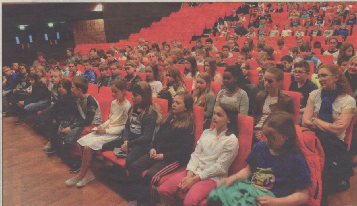
Près de huit cents scolaires ont assisté au spectacle de danse sur deux séances