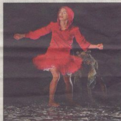
Voilà un Petit Chaperon rouge qui mêle à merveille les codes du hip-hop et du classique, mi-sweat mi-tutu

Au total, près de huit cents écoliers d'Yvetot ont assisté au spectacle, ainsi qu'une classe du collège de Yerville dans le cadre également d'un projet pédagogique avec la compagnie.